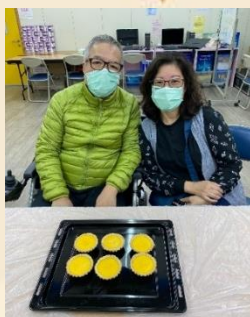
港式牛油蛋撻工作坊