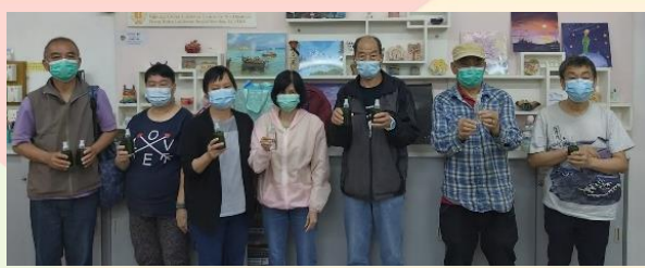
自製洗手間消臭抗菌噴霧