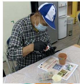
馬賽克小花盆製作

督印人 數量 中心資料： 地址 電話 傳真 電郵 網頁 聽障支援電話 手語翻譯電話 外出活動電話